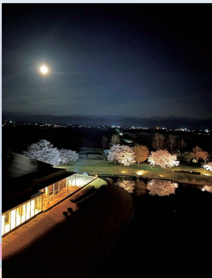
(満月直前3月31日撮影、夜桜、柴山潟)